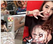
แฉ! ไม่รีรอ! แจ้งข่าวทันชีวิตคู่! ติดหู-ไวรัลเงินเป็นเพื่อน