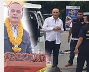
เจาะชีวิต"ชาดา" ไทยเศรษฐ์ ชีวิตสุดภาคภูมิใจไม่ธรรมดา