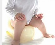
วิธีรับมือ! เมื่อ ลูกน้อยท้องผูก ด้วยโยเกิร์ตธรรมชาติ