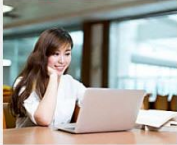
แหล่งชุมชนวัยใหม่สำหรับคนที่เกิดระหว่างปี.ศ. 2484 ถึง 2524 Survey Compare