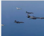
สหรัฐส่งบี-1บีขู่เตือนเกาหลีเหนือ