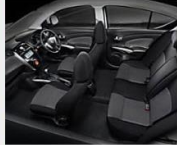
หลุดที่สโล! แรงความเหิมเหิมเหนือระดับ ในรถนิสสัน